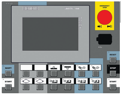
CONTROL PANEL: SIEMENS (X-CNC)